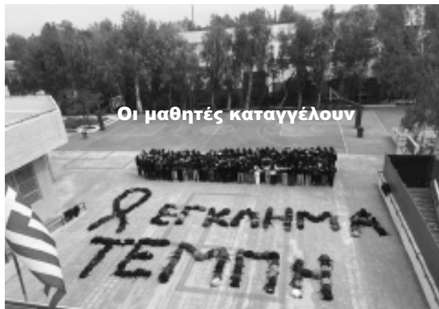
Οι μαθητές καταγγέλουν

αυτά γράφει για το τραγικό δυστύχημα: «Βράδυ της 1ης Μαρτίου 2023. Ανοίξαμε τις τηλεοράσεις και είδαμε εικόνες καταστροφής, ακούσαμε για νεκρούς, για ανθρώπους που εξαυλώθηκαν από τη φωτιά, παιδιά που χαροπαλεύουν στις εντατικές, παιδιά που σώθηκαν και η φωνή τους έτρεμε από το σοκ. Παιδιά...18, 19, 20 χρονών. Φοιτητές που πήγαν να περάσουν τρεις μέρες με την οικογένειά τους ή να διασκεδάσουν στο Καρναβάλι της Πάτρας κι επέστρεφαν στη ρουτίνα τους. Παιδιά γαμώτο... Παιδιά...»