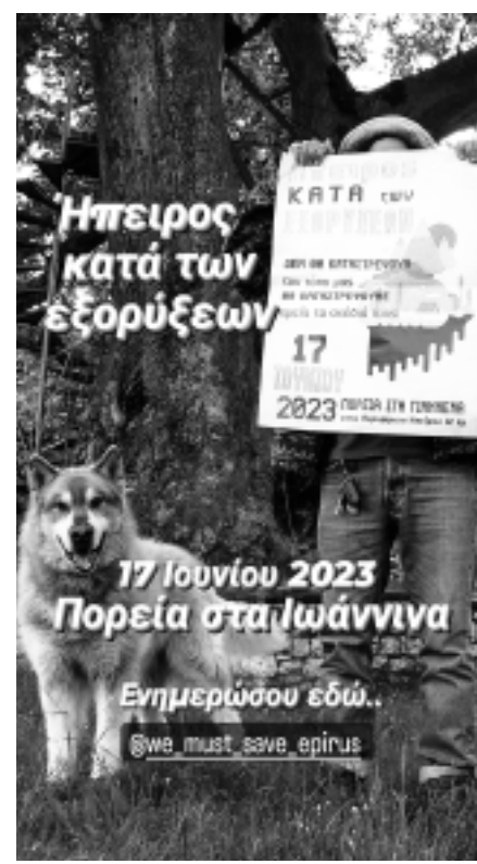
ΣΥΝΕΧΕΙΑ ΑΠΟ ΤΗ ΣΕΛ. 1

- Στη δεύτερη παρουσιάζουμε την αφίσσα από την κινητοποίηση στα Γιάννινα στις 17 Ιουνίου 2023. « Η Ήπειρος ήταν και θα είναι ένας ενιαίος φυσικός χώρος όπου η φύση πάντα θα νικάει! Με αγωνιστικούς χαιρετισμούς», σημειώνεται στην προβολή της.