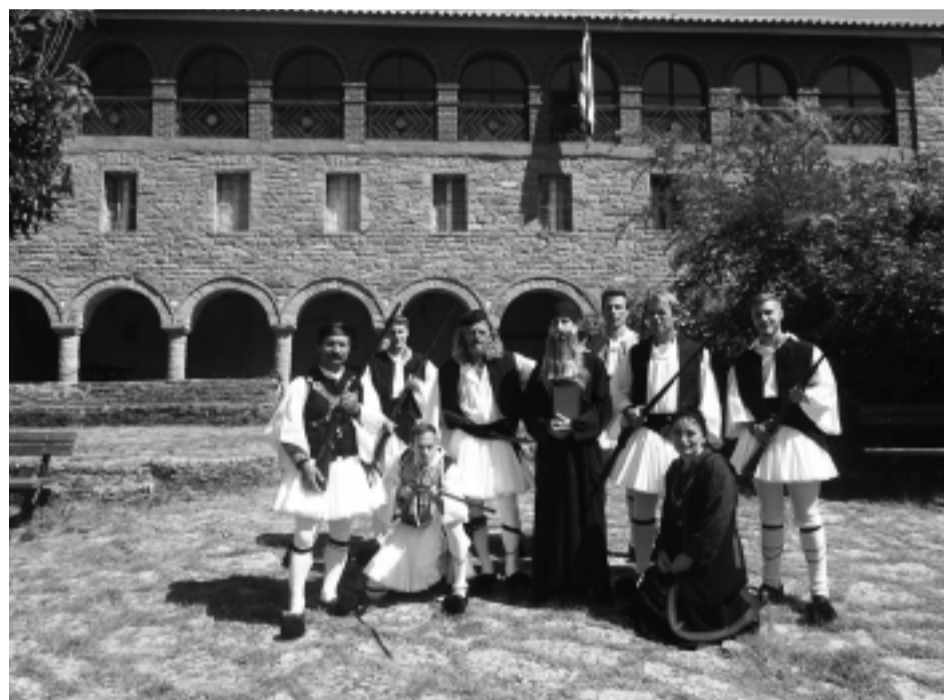
Από την αναπαράσταση της σύναξης των καπεταναίων και δεξιά οι συντελεστές της αναπαράστασης.

Με λαμπρότητα, με ικανοποιητική προσέλευση κόσμου και με την παρουσία αρχών κι επισήμων εορτάστηκε και φέτος στην Ι.Μ. Αγίου Γεωργίου Βουργαρελίου, η καθιερωμένη επέτειος κήρυξης της Επανάστασης στα Τζουμέρκα, τον Ιούλιο του 1821.