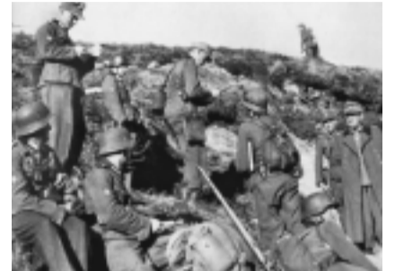
Οι Γερμανοί στο Παλαιοκάτουνο.