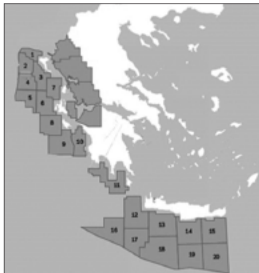
Παραχωρήσεις για εξορύξεις υδρογονανθράκων (Δυτ. Ελλάδα και Ν. Κρήτη).

Οι αντιδράσεις για την κύρωση των συμβάσεων ήταν πολλαπλές και από διάφορους φορείς. Από Ομοσπονδίες, Συλλόγους, ομάδες διαμαρτυρίας και συγκεντρώσεις σε όλες τις