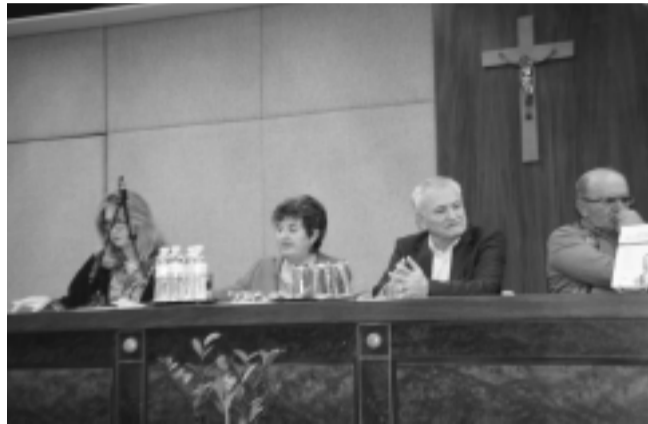
Στιγμιότυπα από την εκδήλωση.

Κώστας Χατζόπουλος. Και η αποκάλυψη: Η Ευτυχία Παπαγιαννοπούλου για τον Κρυστάλλη, ποίημα γραμμένο το 1946, όπως καταγράφεται από το Λευτέρη Παπαδόπουλο στο περιοδικό "Δίφωνο" .