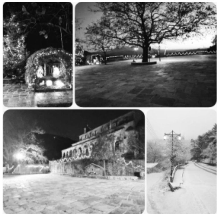
ΑΛΛΕΣ ΓΙΟΡΤΙΝΕΣ ΕΚΔΗΛΩΣΕΙΣ ΤΟΥ ΠΟΛΙΤΙΣΤΙΚΟΥ ΣΥΛΛΟΓΟΥ ΒΟΥΡΓΑΡΕΛΙΟΥ ΣΕΛ. 3

Η πρώτη δραστηριότητα για τους μικρούς μας φίλους ξεκίνησε από το Βακούφικο στην άκρη της Πλατείας. Φέτος είχε κάτι ξεχωριστό. Τα παιδιά συμμετείχαν από την αρχή μέχρι και το ψήσιμο στην Παρασκευή κουλουριών, τα οποία στη συνέχεια γεύτηκαν με ιδιαίτερη όρεξη, έργα δικά τους βλέπεις. Και φέτος υπήρχαν οι πινάτες (χειροποίητες κολοκύθες που από μέσα τους μετά το σπάσιμο ξεχύθηκαν καραμέλες). Και στον επίλογο ο Άγιος Βασίλης που απ' τα χέρια του τα παιδιά πήραν τα δώρα τους.