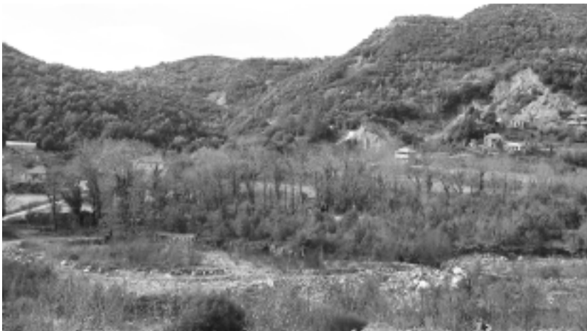
Αποψη της Αβαρίτσας. Σε πρώτο πλάνο η ευρεία κοίτη του ορμητικού χειμάρρου.

τομος γκρεμός και δύσβατη χαράδρα, αλλά επικλινή δασωμένη πλαγιά την οποία μπορούσε κανείς να ανεβεί και κατεβεί με σχετική ευκολία! Στην επικλινή αυτή πλαγιά άνοιξαν διάδρομο για να κατεβάσουν τους τεράστιους κορμούς των ελάτων μέχρι το Γιαννίτσι.