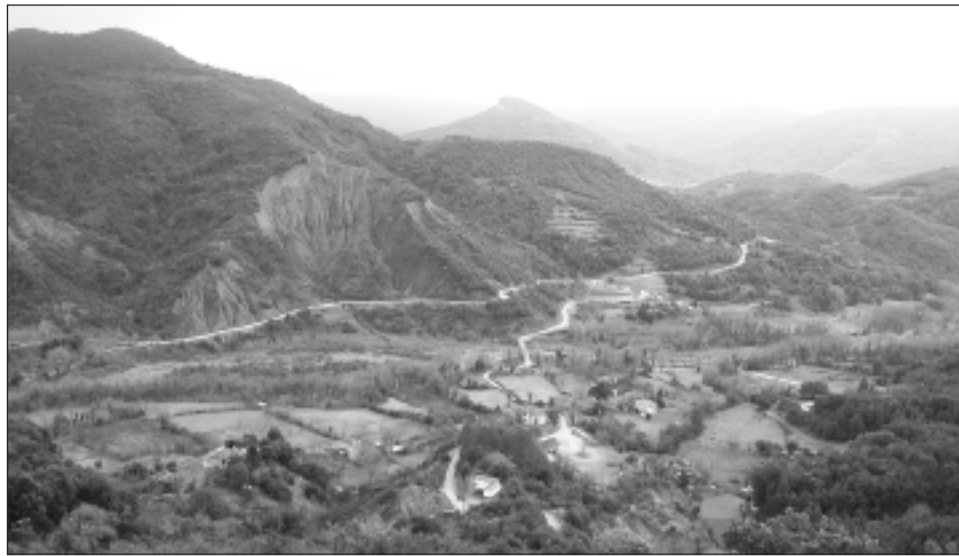
Η κοιλάδα της Αβαρίτσας και στο βάθος, σε δεύτερο πλάνο, διακρίνεται ο λόφος της Τσιούκας.

Σε ότι αφορά τόσο την θέση "Μαρκενί" όσο και την ευρύτερη περιοχή "Μαρκενί" το υψόμετρο δεν είναι ακριβώς το ίδιο. Επιπλέον δεν γνωρίζουμε αν το δίκτυο του υδρα-