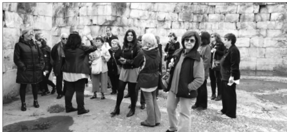
Πάνω, η Μονή Παναγίας Σκριπούς και κάτω στο κέντρο του θολωτού τάφου του Μινύου η ομάδα των εκδρομέων.

Μικηναϊκός θολωτός τάφος του θρυλικού βασιλιά των Μινυών και ιδρυτή του Μινυείου Ορχομενού. Βρίσκεται κοντά στα ερείπια του προϊστορικού οικισμού και κοντά στο μεταγενέστερο θέατρο της πόλης. Κατασκευάστηκε το 1250 π. Χ. και σε αυτόν πρέπει να έχουν ταφεί μέλη της βασιλικής οικογένειας. Στους ελληνιστικούς χρόνους χρησίμευσε ως τόπος λατρείας. Τον τρόπο κατασκευής του τον θαύμασε ο Πausanias καθώς το 2 μ. Χ., 15 αιώνες μετά την κατασκευή του, διατηρούσε άθικτα τη θόλο και τον δρόμο του. Το μνημείο έφεραν στο φως οι ανασκαφές του Ερρίκου Σλήμαν.