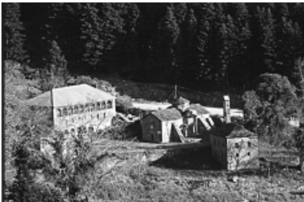
Το μοναστήρι του Αϊ-Γιώργη και κάτω από τον εορτασμό των 150 χρόνων (1971) από την έναρξη της Επανάστασης στα Τζουμέρκα, στον ίδιο χώρο.

Όμως η επίσημη πολιτεία έχει εξαγγείλει ότι το 2021, που συμπληρώνονται 200 χρόνια από την έναρξη της Επανάστασης του 1821, θα γίνουν ιδιαίτερες εκδηλώσεις. Εμείς ως Δήμος Κεντρικών Τζουμέρκων και ως Βουργαρέλι που είναι και έδρα του δήμου και στο χώρο του έλαβε χώρα αυτό το γεγονός πανελλαδικής εμβέλειας πρέπει να το φροντίσουμε όπως ιδιαίτερα να φτάσει η εκδήλωση στο ύψος που της ταιριάζει.