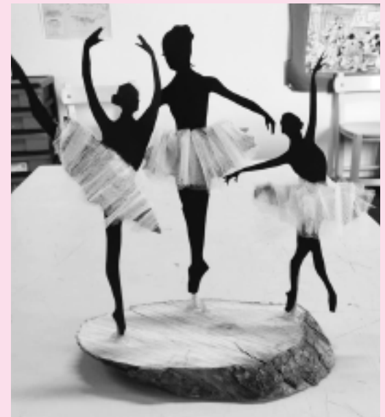
"Πάμε σαν άλλοτε"