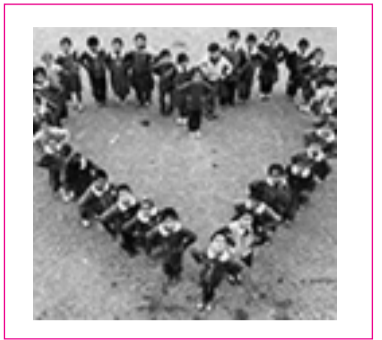
Ένα παιδί, ένα βιβλίο, ένας δάσκαλος μπορούν να αλλάξουν τον κόσμο!