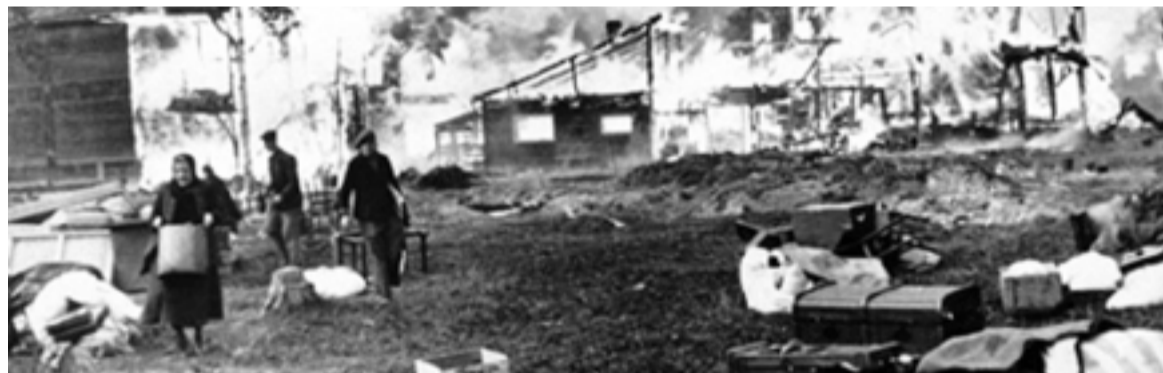
Μέρες μνήμης: 5 Μαΐου 1943. Βομβαρδισμός του Βουργαρελίου από τους Γερμανούς. 3 Οκτωβρίου 1943: Κάψιμο του Βουργαρελίου από τους Γερμανούς. 22 Οκτωβρίου 1943: Κάψιμο του Παλαιοκάτου από τους Γερμανούς.

ΜΕΡΕΣ τώρα στριφογυρίζουν στο μυαλό μου διάφορες σκέψεις ενόψει των γιορτινών ημερών. Πώς να απευθυνθώ σε σας, αγαπητοί συγχωριανοί, μέσα σ' αυτό το περίεργο κλίμα που ζούμε; Ένα "κλίμα" που πέρσι τέτοιοι καιρό ούτε που μπορούσαμε να φανταστούμε, ξεπερνώντας κάθε τρελή μας σκέψη. Πάντα το κείμενο σ' αυτή τη σελίδα είχε να κάνει με ωραίες σκέψεις, χαρούμενες, μέσα στην εορταστική ατμόσφαιρα αυτών των ημερών, με αναφορές σε ήθη, έθιμα (κάλαντα, γιορτινό τραπέζι, ανταμώματα, εκδηλώσεις, δώρα). Τώρα οι αναφορές θα γίνουν σε αυτά που στερηθήκαμε, για να εκτιμήσουμε όσα απολαμβάναμε τα προηγούμενα χρόνια και δεν τους δίνουμε την αξία που θα έπρεπε.