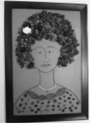
Γεμάτες έμπνευση από το όμορφο περιβάλλον του χωριού μας οι δημιουργίες των παιδιών!