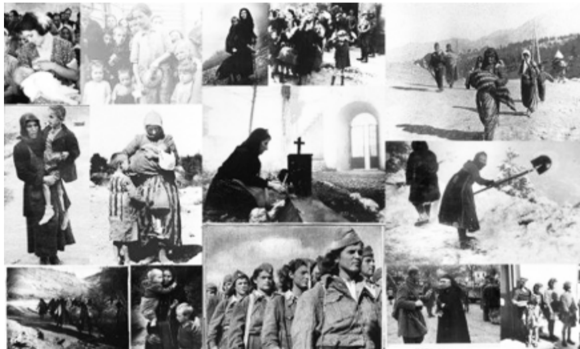
Ηπειρώτισσες - "Ξαφνιάσματα της φύσης": Και επειδή το χρέος μας σ' εκείνες τις γυναίκες δεν ξεπληρώνεται τουλάχιστο - μέρες που έρχονται - ένα κεράκι στη μνήμη τους είναι η ελάχιστη τιμή στην προσφορά τους.