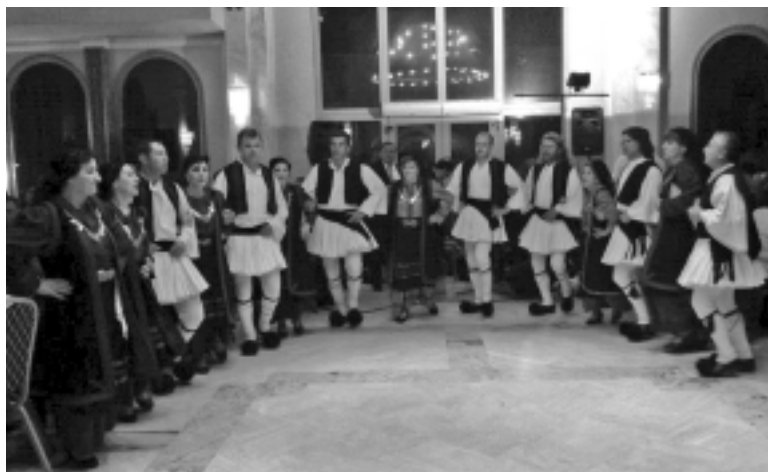
Από το χορό της Ένωσης: Το χορευτικό του Βουργαρελίου