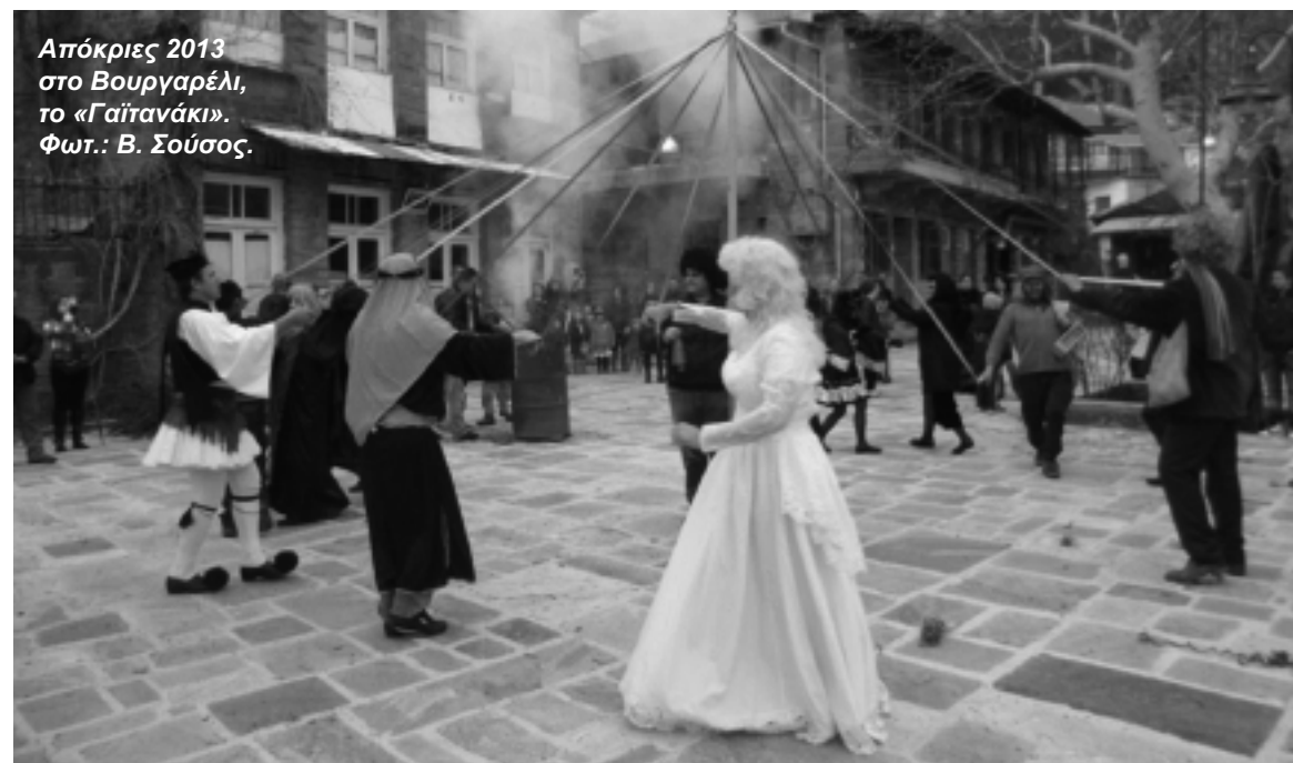
Απόκριες 2013 στο Βουργαρέλι, το «Γαϊτανάκι».

Στασινού Έλια Καθηγήτρια Αγγλικών στα Τζουμέρκα