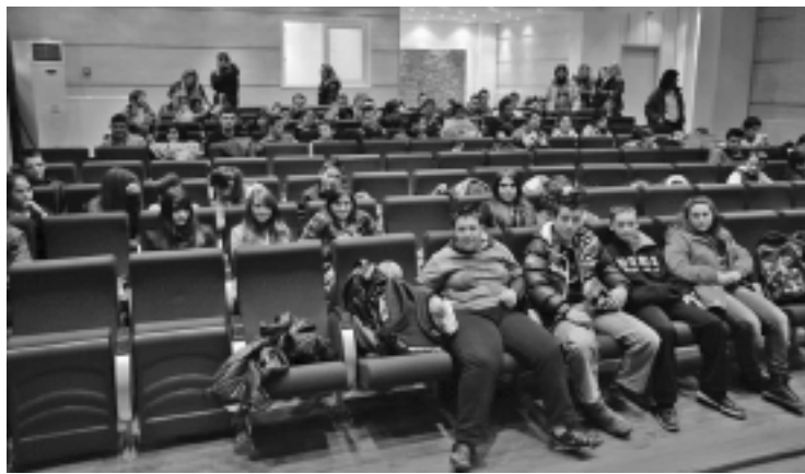
Τα παιδιά της χορωδίας

Η δική μας πρωτοβουλία ήταν η προβολή μιας ταινίας με θετικά μηνύματα για τους μαθητές μας. Η ταινία, γαλλικής παραγωγής, υποψήφια