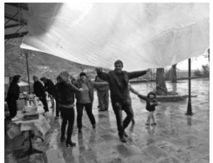
Καθαρή Δευτέρα 2013 στην πλατεία