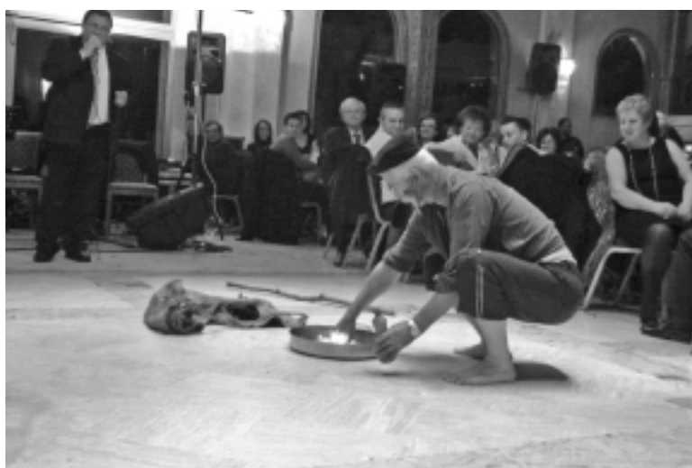
Από το χορό της Ένωσης: Ο καλαντζής σε δράση

Στις 2 Μάρτη 2013, έγινε ο αποκριάτικος χορός της Ένωσης Συλλόγων στο ξενοδοχείο «BYZANTINO» στην Άρτα. Ο τοπικός τύπος χαρακτήρισε το συμβάν ως εκδήλωση της χρονιάς, τόσο από πλευράς γλέντιου και κεφιού όσο και από συμμετοχή, η οποία ξεπέρασε κάθε προσδοκία του ΔΣ. Το σχόλιο αυτό δεν είναι υπερβολικό. Ήταν πράγματι μια «γεμάτη» και πολύ ζεστή εκδήλωση, με όλα εκείνα τα στοιχεία που της προσδίδουν τους παραπάνω χαρακτηρισμούς. Εκτός από τους Τζουμερκιώτες παρόντες ήταν και πολλοί φίλοι της περιοχής, οι οποίοι ένιωσαν σαν στο σπίτι τους, αφού η Ένωση φρόντισε για μια θερμή φιλοξενία. Ο ήχος του κλαρίνου και τα παραδοσιακά τραγούδια διασκέδασαν τους παρευρισκόμενους μέχρι τις πρώτες πρωινές ώρες. Το χορευτικό του Πολιτιστικού Συλλόγου Βουργαρελίου με παραδοσιακές στολές εντυπωσίασε όλους στη χορευτική εκτέλεση παραδοσιακών τοπικών τραγουδιών. Ατραξιόν της βραδιάς η...θεατρική χορευτική αναπαράσταση του καλαντζή, η οποία καταχειροκροτήθηκε. Το παραδοσιακό καγκελάρι, που το τραγουδούσαν ζωντανά και το χόρευαν σχεδόν όλοι σε μεγάλο κύκλο ταξίδεψε τους Τζουμερκιώτες και τους αγαπητούς φίλους τους σε καλοκαιρινά γλέντια και πανηγύρια στα όμορφα Τζουμερκοχώρια. Ως και λαχειοφόρο αγορά είχε ο χορός, για την ενίσχυση του ταμείου της Ένωσης.