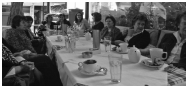
Από τη συνάντηση των γυναικών του Συλλόγου στην Πλάκα.