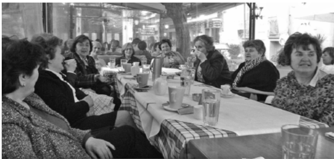
Από τη συνάντηση των γυναικών.

Η μάχη για την προστασία του περιβάλλοντος είναι μια μάχη με το χρόνο. Θα τα καταφέρουμε!