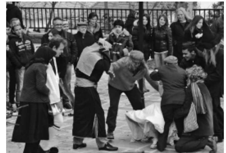
Απόκριες 2013 στο Βουργαρέλι