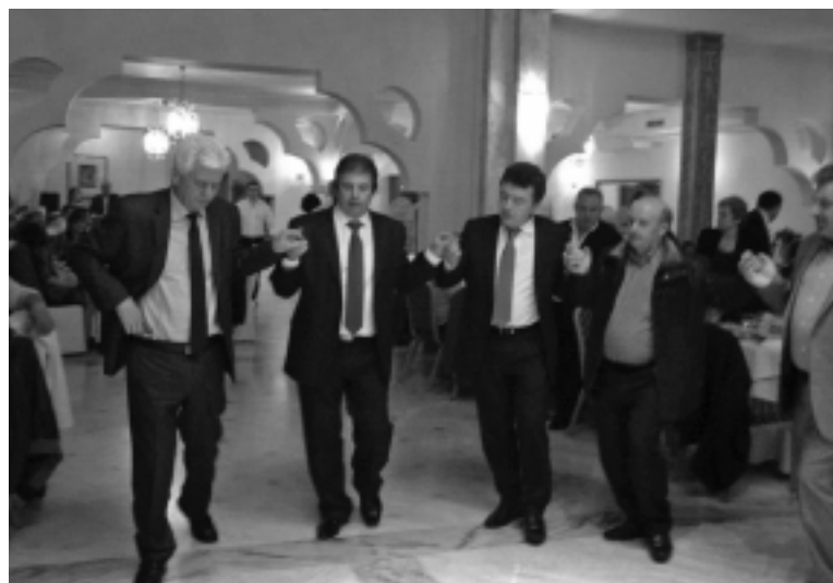
Από το χορό της Ένωσης στο "Βυζαντινό", στην Άρτα.