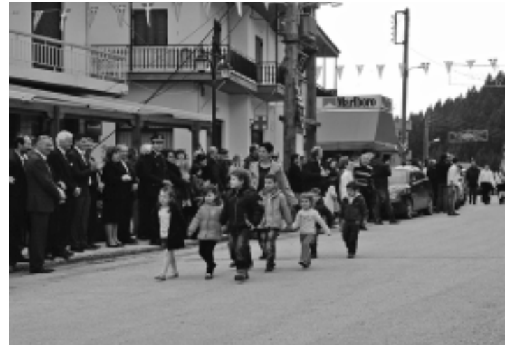
25η Μαρτίου 2013