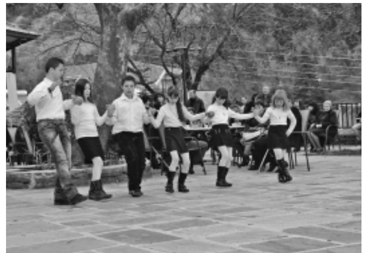
25η Μαρτίου 2013