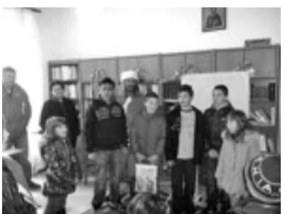
Από τη Χριστουγεννιάτικη γιορτή στα γραφεία του Πολιτιστικού Συλλόγου.