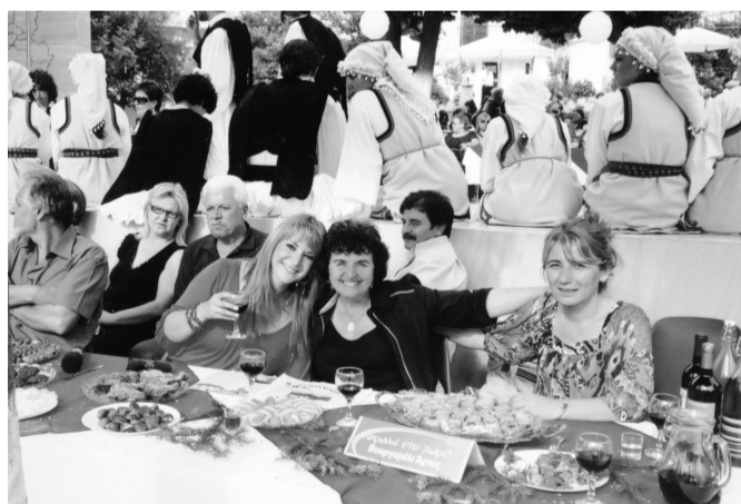
Αντιπροσωπείες των τριών χωριών του Νομού Άρτας, Βουργαρελίου - Αθαμανίου - Ροδαυγής, που παρουσιάστηκαν από την εκπομπή κατά τη διάρκεια της χρονιάς.