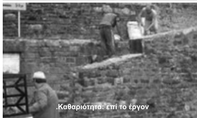
Καθαριότητα: επί το έργον