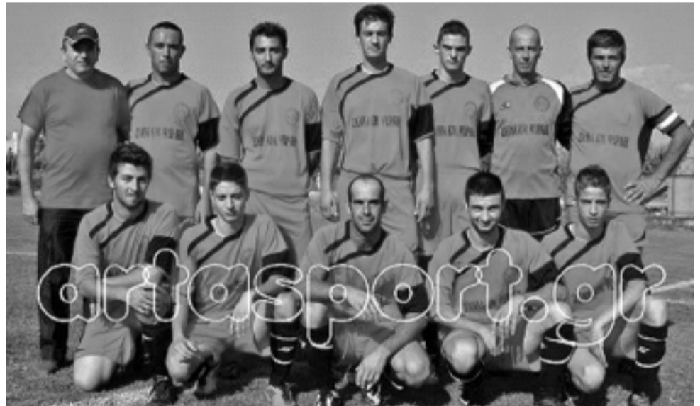
Η ομάδα των Κ. Τζουμέρκων όπως παρουσιάστηκε την φετινή χρονιά

Π Ω Λ Ε Ι Τ Α Ι ΔΙΩΡΟΦΗ ΠΕΤΡΙΝΗ ΟΙΚΙΑ 135 τ.μ. ΣΤΟ ΒΟΥΡΓΑΡΕΛΙ ΣΕ ΟΙΚΟΠΕΔΟ 700 τ.μ. (ΠΡΩΗΝ ΟΙΚΙΑ ΣΑΒΒΟΥΛΑΣ ΠΑΠΑΚΩΣΤΑ) ΠΛΗΡΟΦΟΡΙΕΣ: 210 7481762, 6974916162