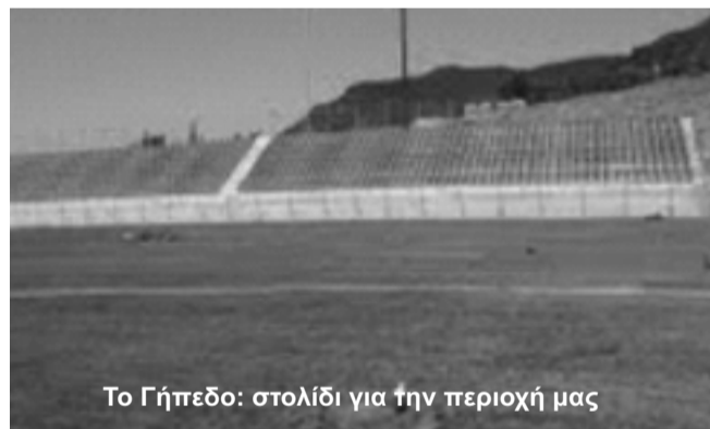
Το Γήπεδο: στολίδι για την περιοχή μας

Στις 19-8-2012 στο χώρο της πλατείας σε συνεργασία με την ένωση συλλόγων θα οργανωθεί εκδήλωση με συμμετοχή χορευτικών από τα δημοτικά διαμερίσματα του Δήμου.