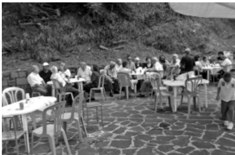
Δύο φωτογραφικά στιγμιότυπα από την εορταστική εκδήλωση στο χώρο του Περιπτέρου του Συνεταιρισμού στον Πλάτανο, μετά τη λειτουργία στη γιορτή της Αγίας Κυριακής, 7 Ιουλίου.