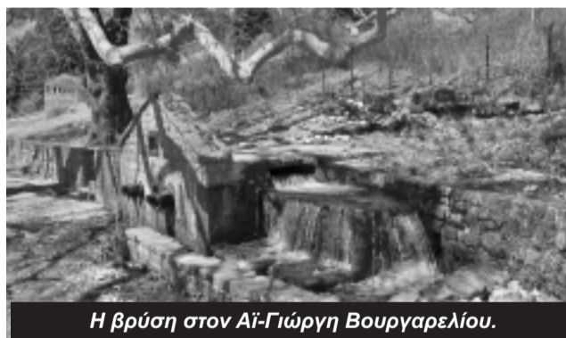
Η βρύση στον Αϊ-Γιώργη Βουργαρελίου.

Απόσπασμα: "Το νερό άρρηκτα συνδεδεμένο με την ύπαρξη της ίδιας της ζωής, αποτελεί απαραίτητο συστατικό επιβίωσης όλων των έμβιων οργανισμών και διατήρησης των οικοσυστημάτων του πλα-