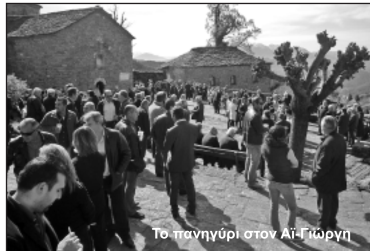
Το πανηγύρι στον Αϊ-Γιώργη

Η εφημερίδα και ο Σύλλογος στηρίζονται στις δικές σας συνδρομές. Μπορείτε να τις στέλνετε και με επιταγή στη διεύθυνση: Εφημερίδα "ΤΟ ΒΟΥΡΓΑΡΕΛΙ" Φειδίου 18 106 78 Αθήνα