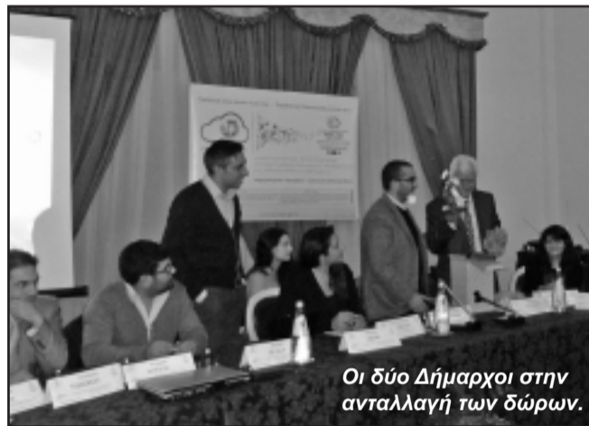
Οι δύο Δήμαρχοι στην ανταλλαγή των δώρων.

Στο πλαίσιο του Ευρωπαϊκού Προγράμματος Εδαφικής Συνεργασίας Ελλάδα – Ιταλία 2007-2013, «Παραδοσιακό – Διασυνοριακό Μουσικό Κουτί», πραγματοποιήθηκε η δεύτερη συνάντηση των δύο εταίρων Δήμων, στο Δήμο του Cellino San Marco, της Ιταλίας, στις 24-25 και 26 Νοεμβρίου του 2012, με σκοπό τη γνωριμία με το Δήμο και την