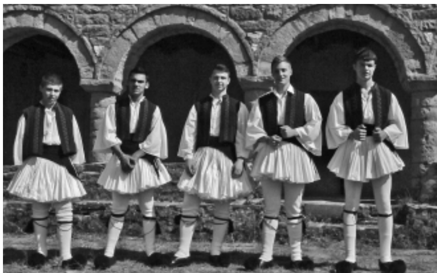
Νέοι του χωριού μας, παλικάρια στην Αναπαράσταση.

Γεγονός όμως αδιαμφισβήτητο είναι ότι η Σύναξη των Καπεταναίων στο Μοναστήρι του Αϊ-Γιώργη στο Βουργαρέλι με επικεφαλής τους: Γεώργιο Καραϊσκάκη, Μήτρο και Γιαννάκη Κουτελίδα, Γώγο Μπακόλα, Μάρκο Μπότσαρη κ.ά. , που ενωμένοι όλοι μαζί κατάφεραν να ανάψουν στα Τζουμέρκα τη φλόγα της Επανάστασης και στη συνέχεια με μια σειρά μαχών να αναχαϊτίσουν τους Τούρκους στην πο-