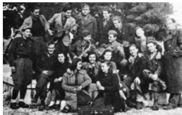
Ο θίασος του Θεάτρου του Βουνού.

Ξεσηκωμένος ο φτωχός απ' το ζευγάρι κι ο άλλος αφήνοντας αφύλαχτη κοπή, τ' ακονισμένο σίδερο έτρεξε να πάρει